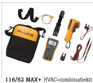
116/62 MAX+ HVAC-combinatiekit