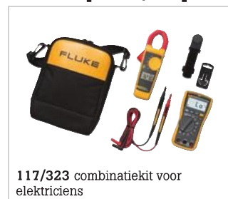
117/323 combinatiekit voor elektriciens